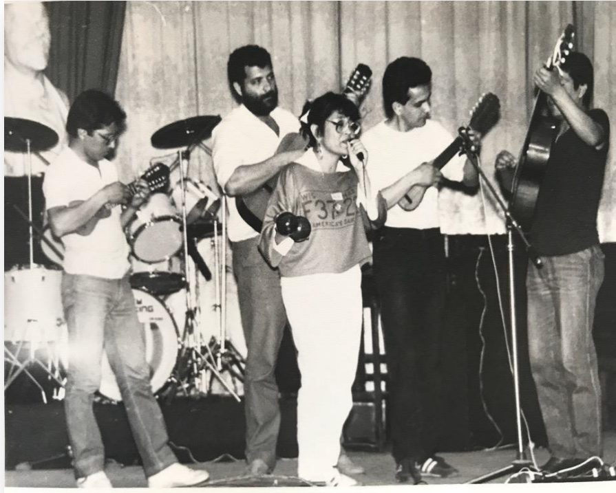
Рис. Г 3. Группа латиноамериканских студентов на концерте в ДонГУ. 1983 г. Фото