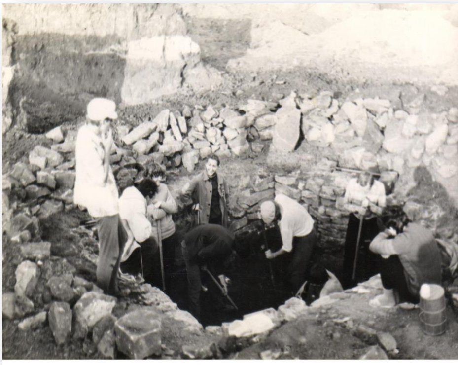
Рис. Д 4. Археологические раскопки у с. Семеновка. 1984 г. Фото