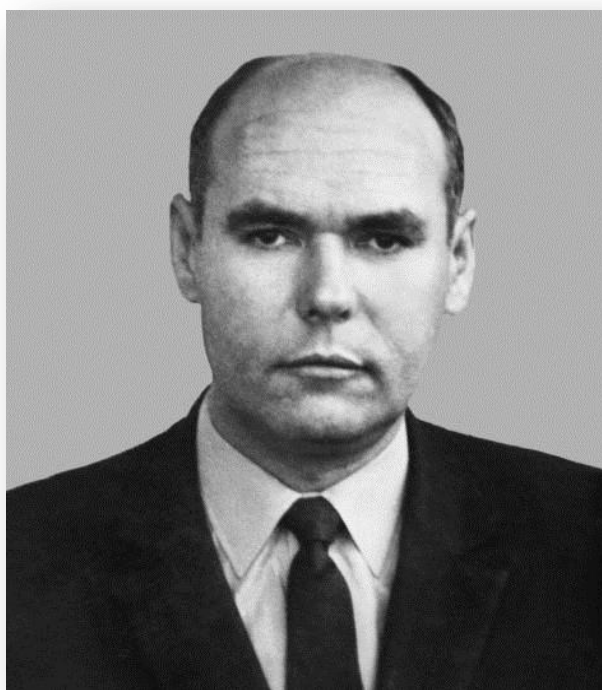
Рис. В 24. Р. Д. Лях. Фото