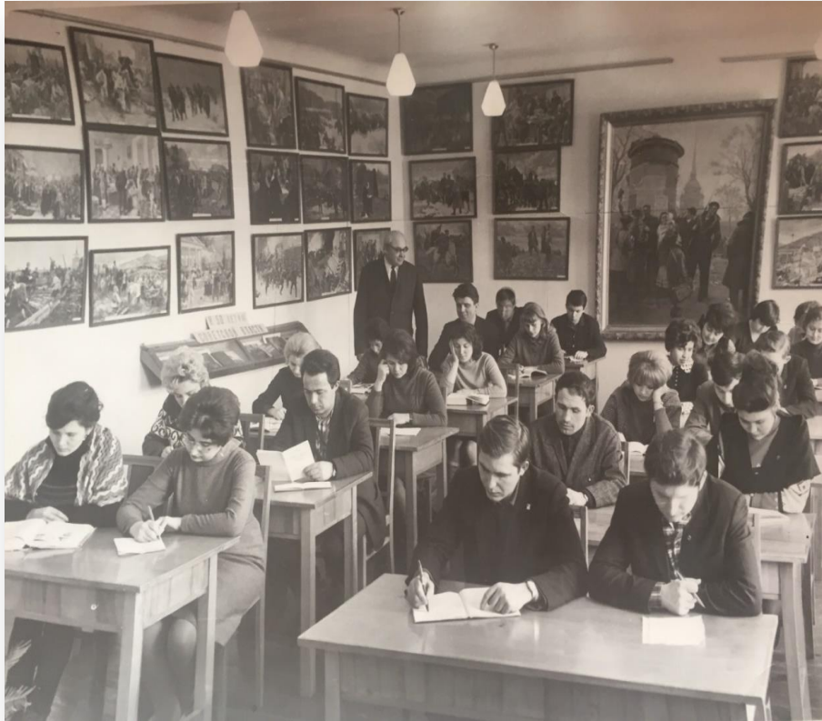
Рис. В 19. В кабинете истории КПСС. 1969 г. Фото