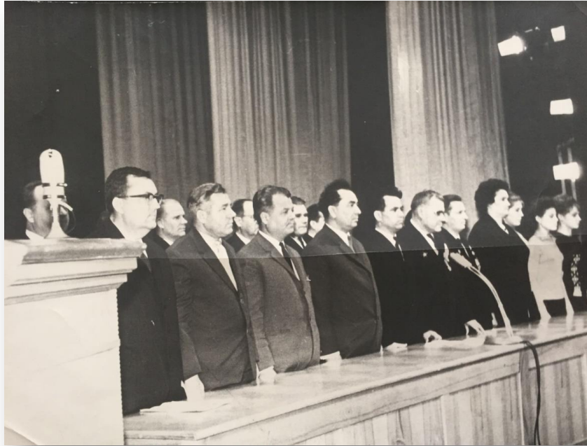
Рис. В 4. Торжественное оглашение о создании Донецкого государственного университета. Оперный театр. 24 декабря 1965 г. Фото