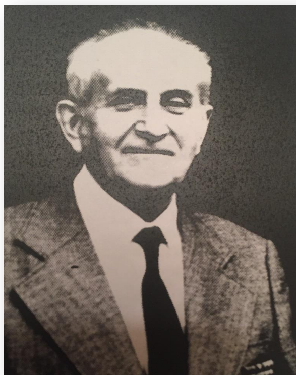
Рис. В 14. А. С. Лисянский. Фото