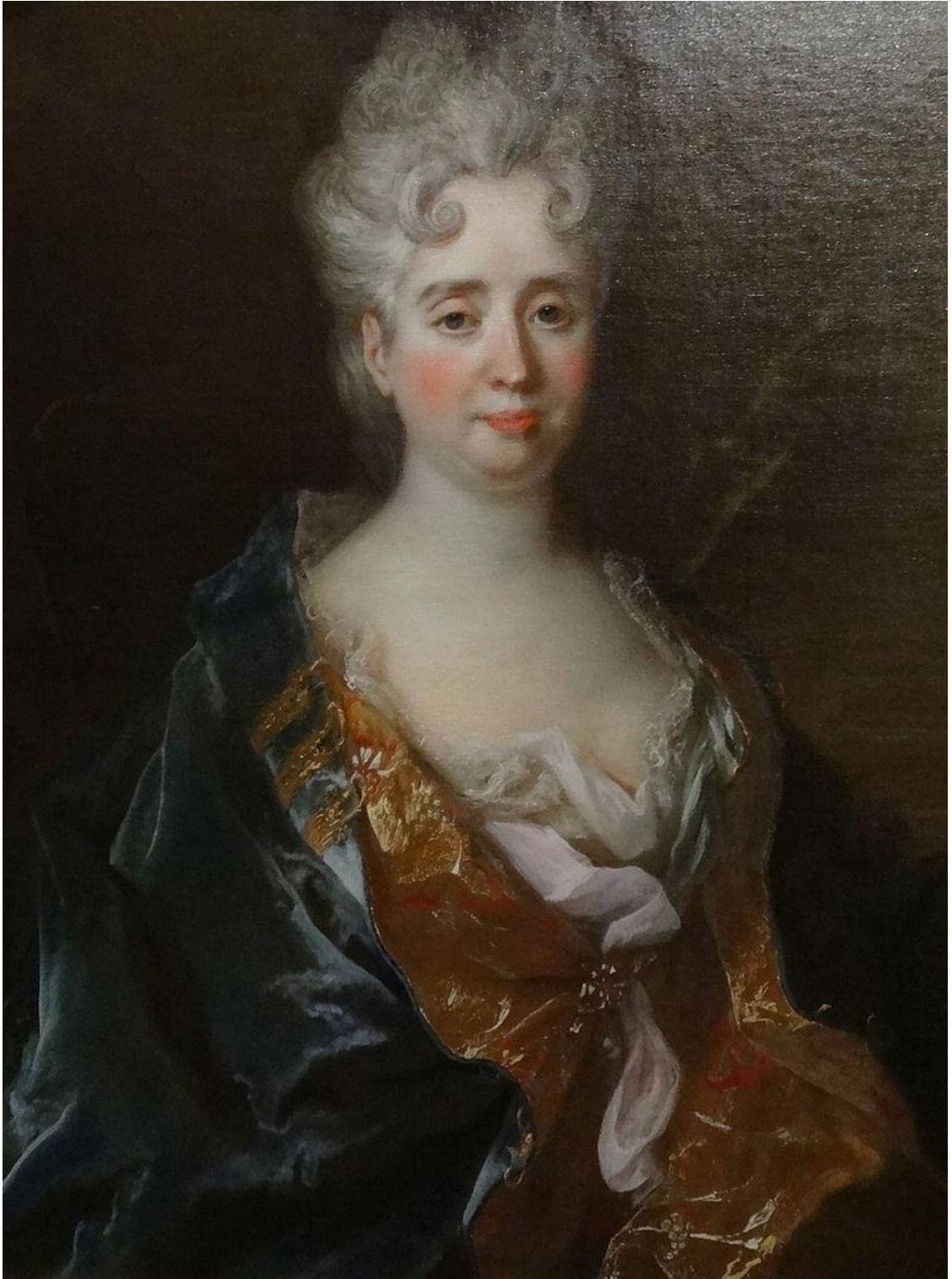
Рис. 2. Портрет маркизы де Ламбер. Автор: Н. де Ларжильер.