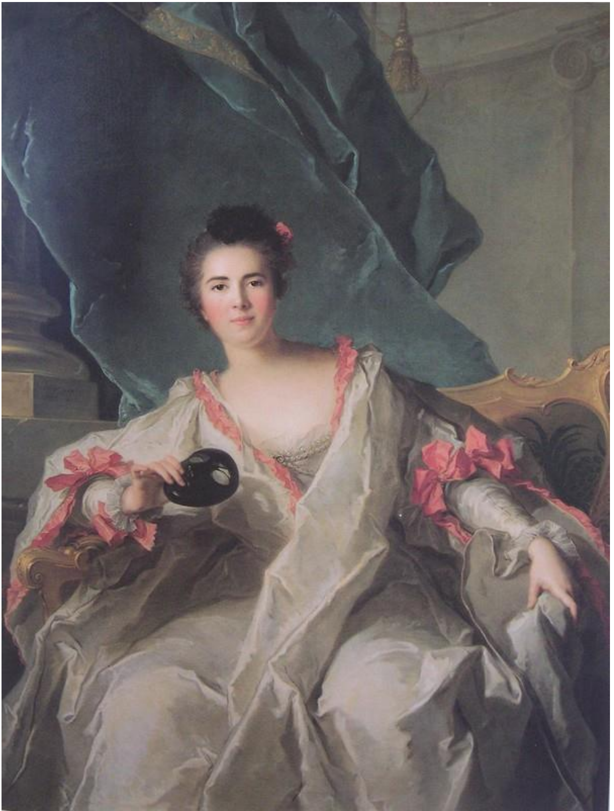
Рис. 7. Портрет маркизы де Ла Ферте-Эмболь. Автор: Ж.-М. Натье.