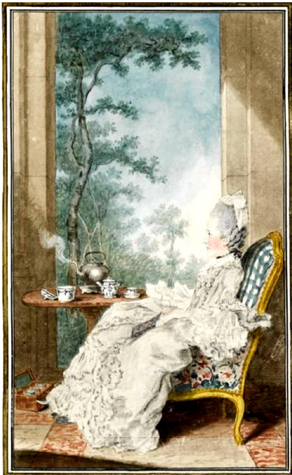
Рис. 9. Портрет графини де Буффле. Автор: Кармонтель.