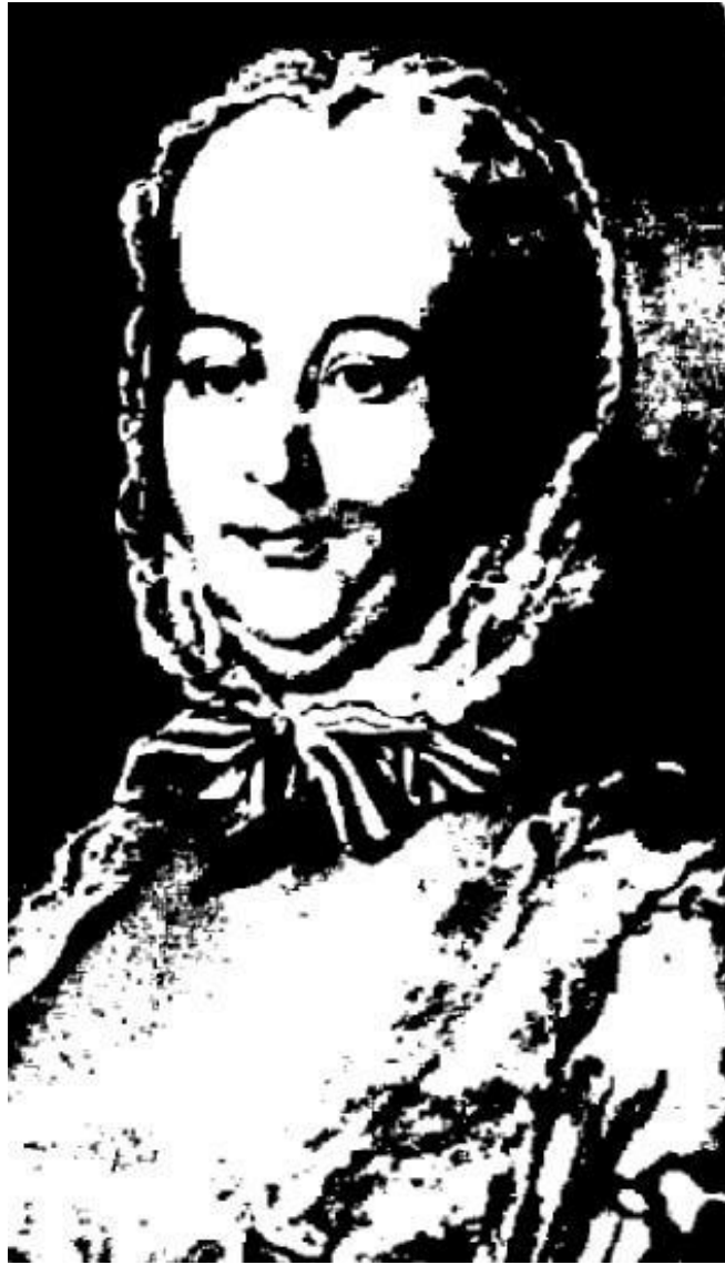
Рис. 8. Портрет герцогини д'Эгийон. Неизвестный автор.