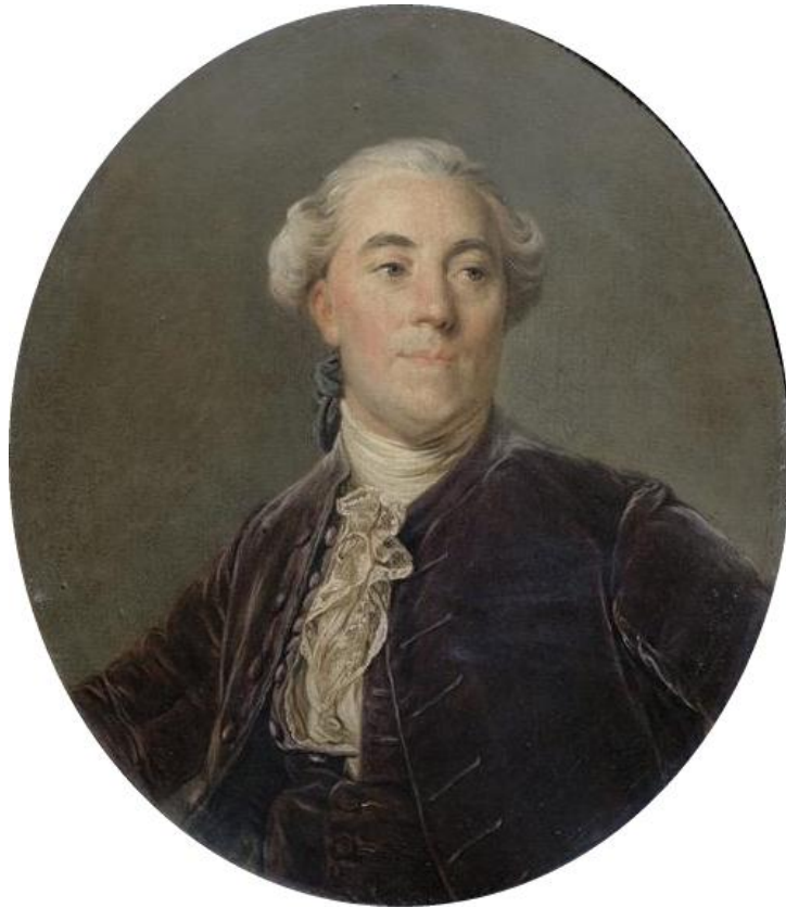
Рис. 13. Портрет Ж. Неккера. Автор: Ж.-С. Дюпlessи.