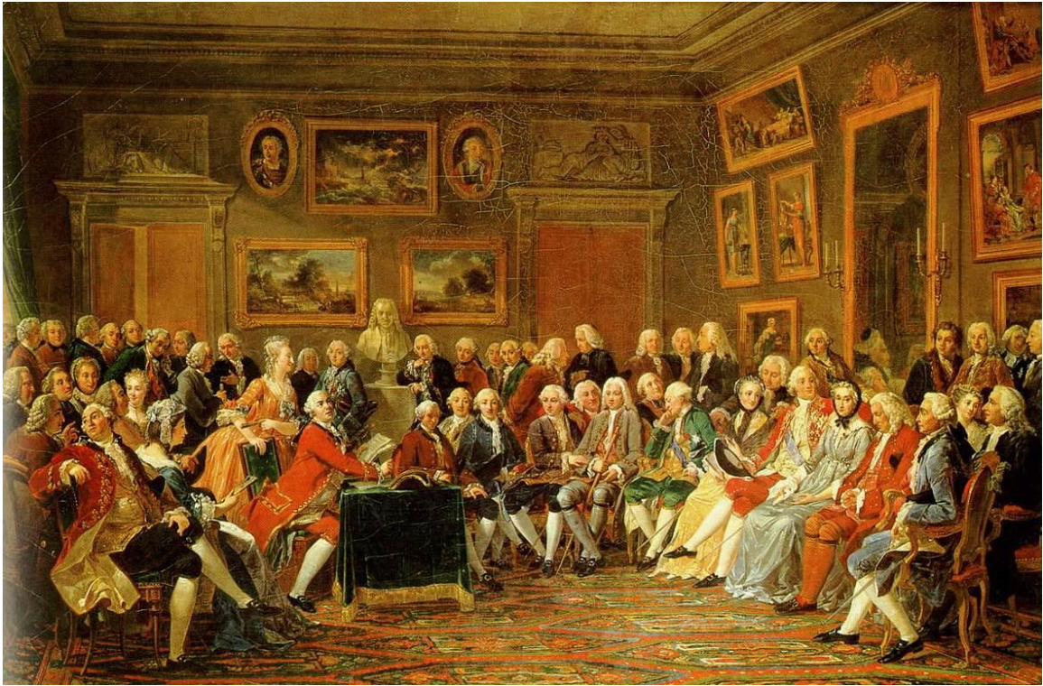
Рис. 11. Чтение трагедии Вольтера «Китайский сирота» в салоне госпожи Жоффрен. Автор: А. Ш. Г. Лемонье.