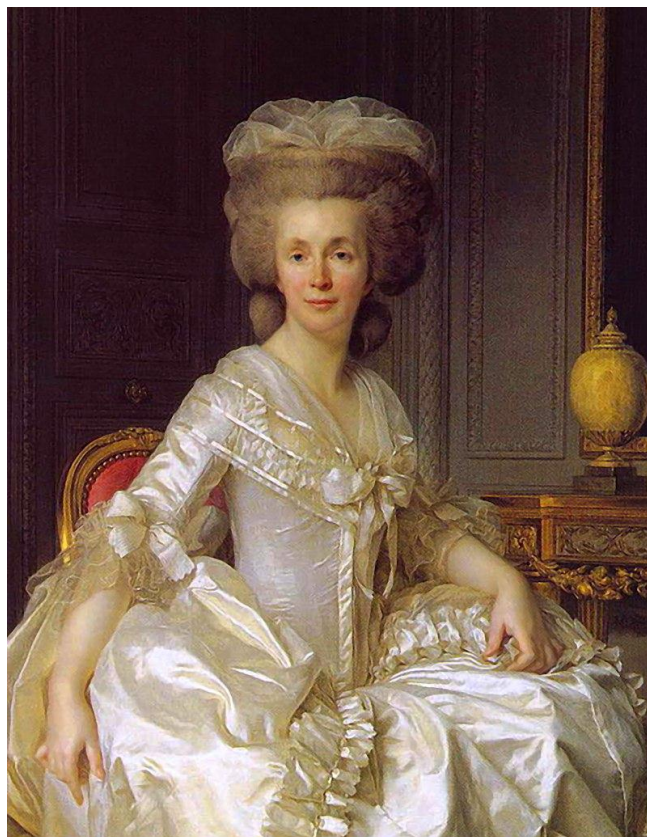
Рис. 14. Портрет С. Неккер. Автор: Ж.-С. Дюпlessи.