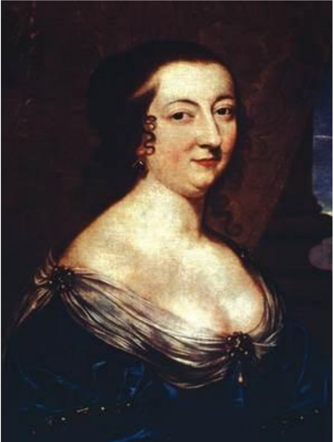
Рис. 1. Портрет маркизы де Рамбуйе. Неизвестный автор.