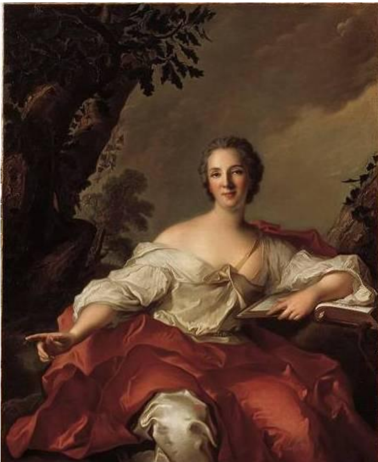
Рис. 6. Портрет мадам Жоффрен. Автор: Ж.-М. Натъе.