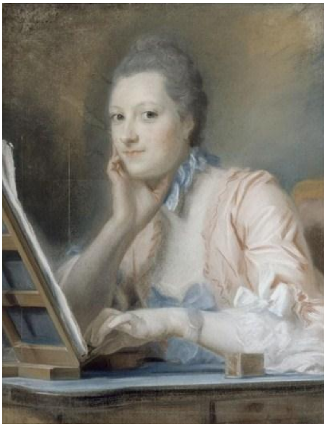
Рис. 10. Портрет мадам де ла Поплиньер. Автор: М. Кантен де Ла Тур.