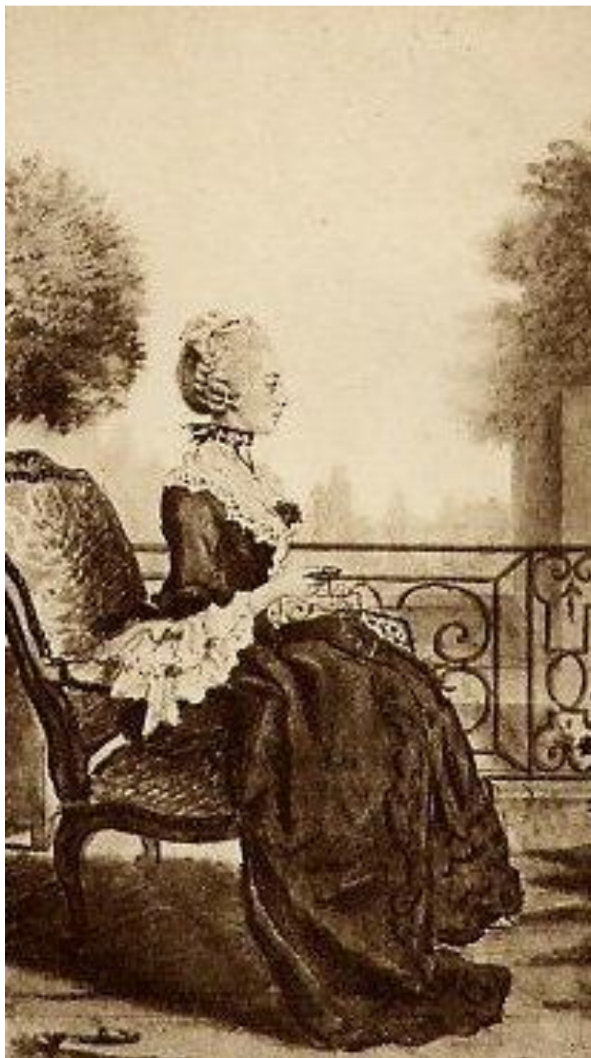
Рис. 5. Портрет Ж. де Леспинас. Автор: Кармонтель.