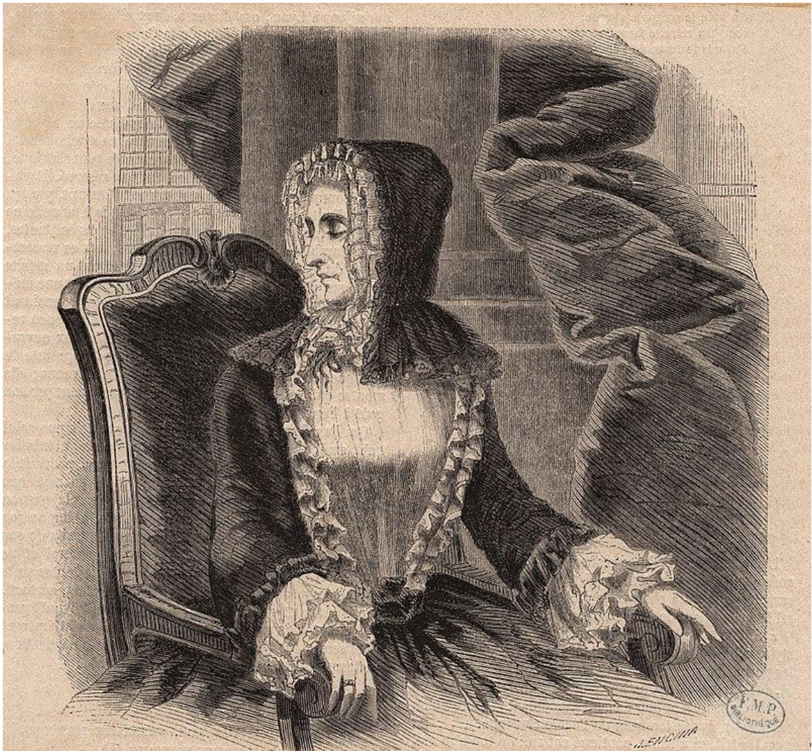
Рис. 4. Портрет маркизы дю Деффан. Автор: Ж. Энсина.