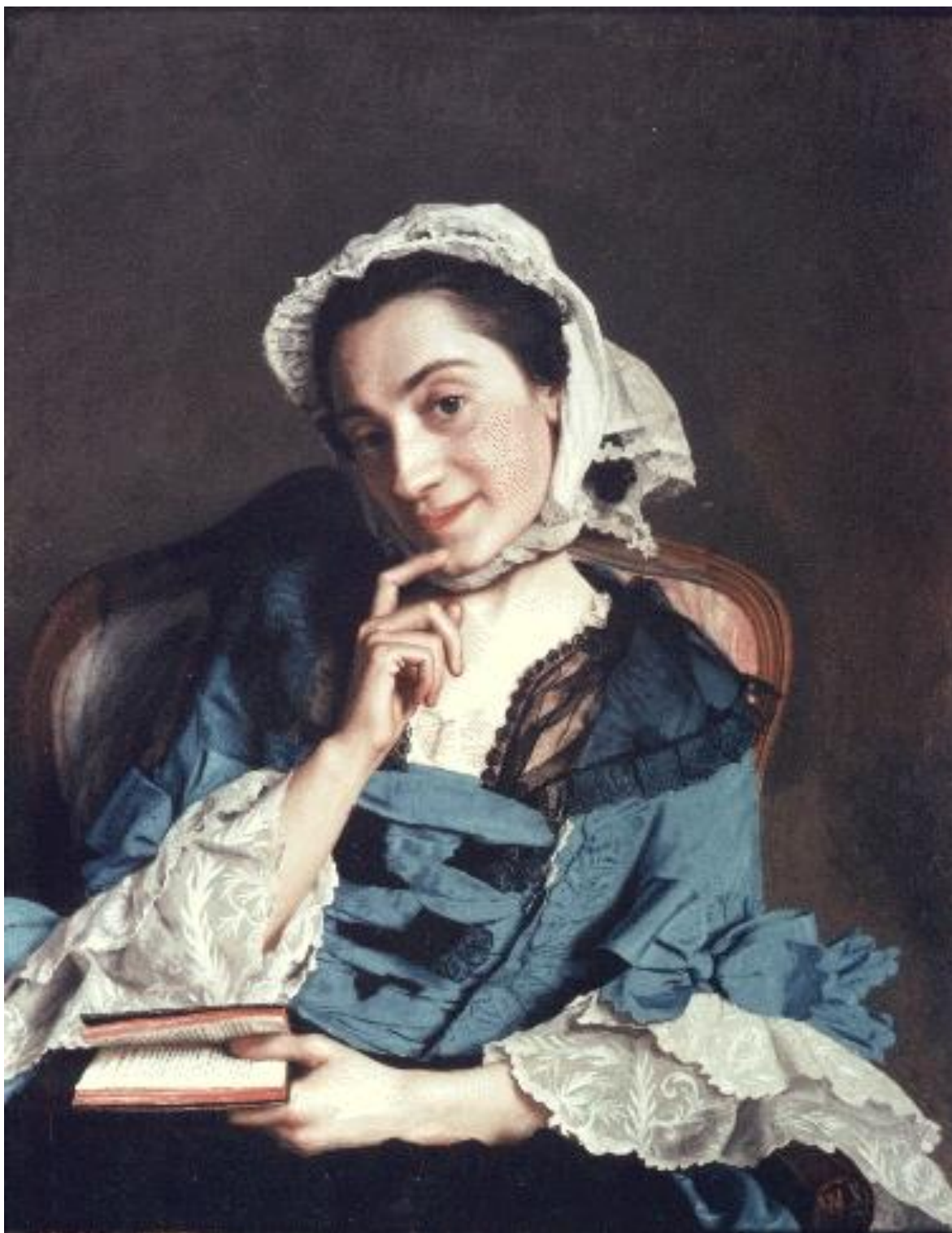
Рис. 12. Портрет мадам д'Эпине. Автор: Ж.-Э. Лиотар.