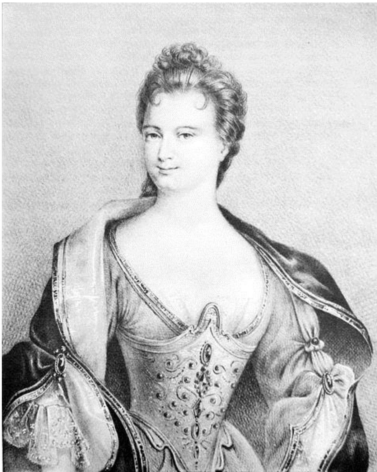
Рис. 3. Портрет мадам де Тансен. Автор: В. Кассиен.