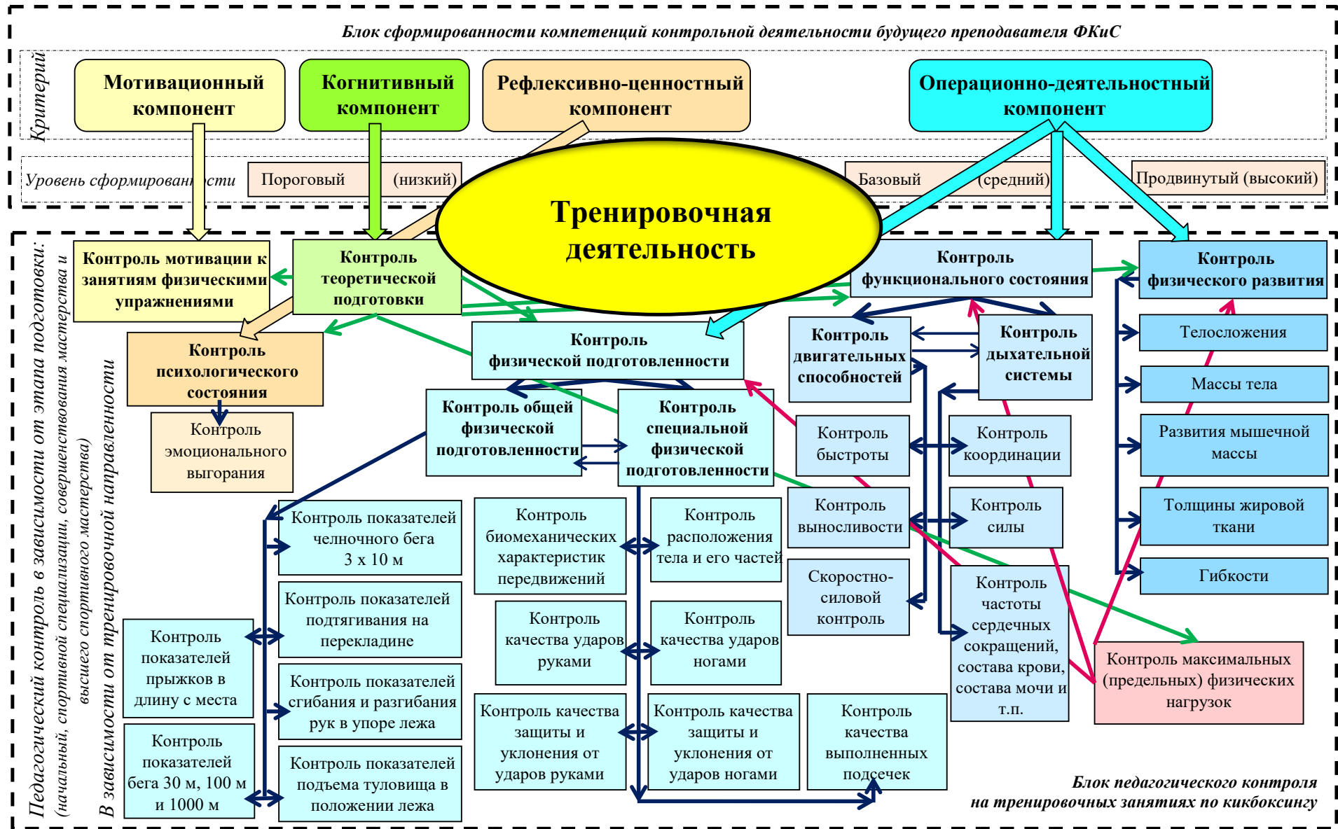
Рисунок 2 – Модель системы педагогического контроля на тренировочных занятиях по кикбоксингу